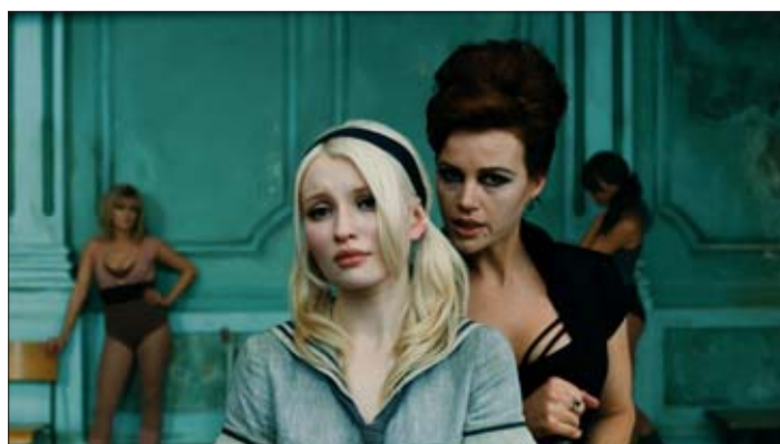
Abbie Cornish ja Carla Cugino antavat Sucker Punch -elokuvassa mallia supersankareille, jotka ihastuttavat yhtä kovaa kuin pojat kuin työtökkin.

syä. Umpimielisen fantastista ja samalla katsojan hoksottimia kutittelevaa elokuvatyylin pitää varmasti ollakin.