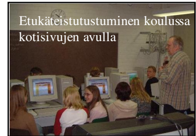
Etukäteistutustuminen koulussa kotisivujen avulla