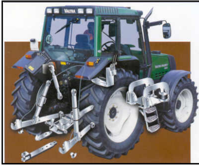
Tuotteina noin 100 traktorinosaa